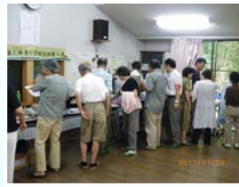
地域の防犯機器展示会

防犯カメラや錠前、防犯建物部品などの優れた防犯機材の展示説明や正しい使用法などをアドバイス致します。