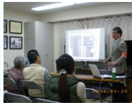
地域の防犯勉強会