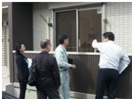
防犯カメラの設置相談

防犯カメラや錠前、入出管理機器、防犯警報機等の設置、導入の検討を指導、助言致します。