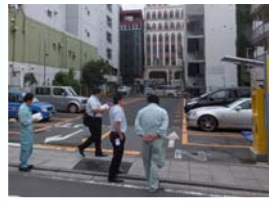
駐車場の防犯診断

防犯対策をお考えの皆様の要請に応じて、直接現場にお伺いし、防犯面の脆弱部分の抽出と対策をアドバイス致します。