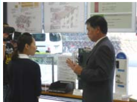
防犯建物部品の説明