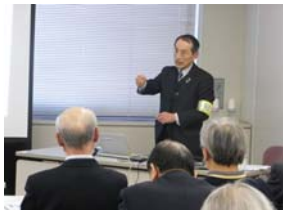
自治会の防犯講座

防犯カメラや錠前、防犯建物部品などの解説や住宅、施設、住環境などを対象とした防犯講座を受講者層に合わせて対応致します。