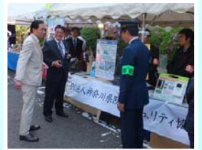
防犯フェスティバル