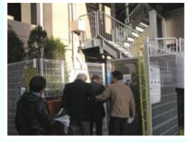
マンションの防犯診断